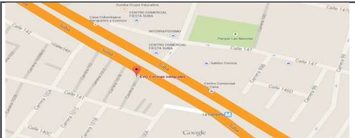
Fotografía No. 3. Elementos instalados en Espacio Público. Operativo en la Localidad de Suba, día 11 de Abril de 2015. Valla en la dirección Carrera 101 # 141-77, al frente del establecimiento EVG Cocinas Integrales, sobre la Avenida Suba.