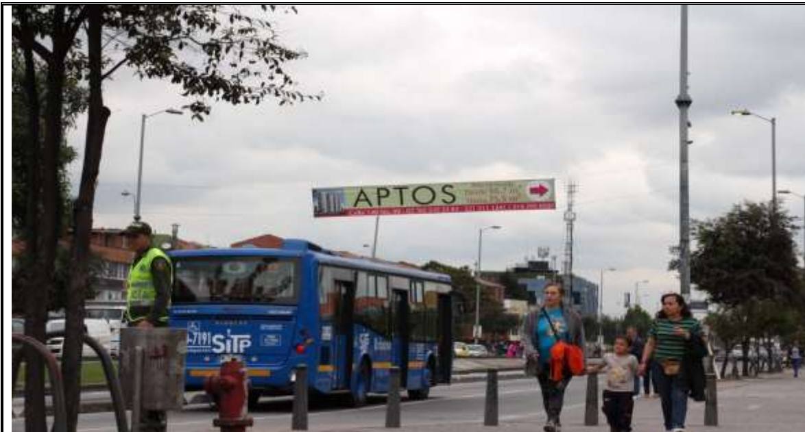
Fotografía No. 1. Elementos instalados en Espacio Público. Operativo en la Localidad de Suba, día 11 de Abril de 2015.

Registro fotográfico, Operativo de Control efectuado el día 11/04/2015