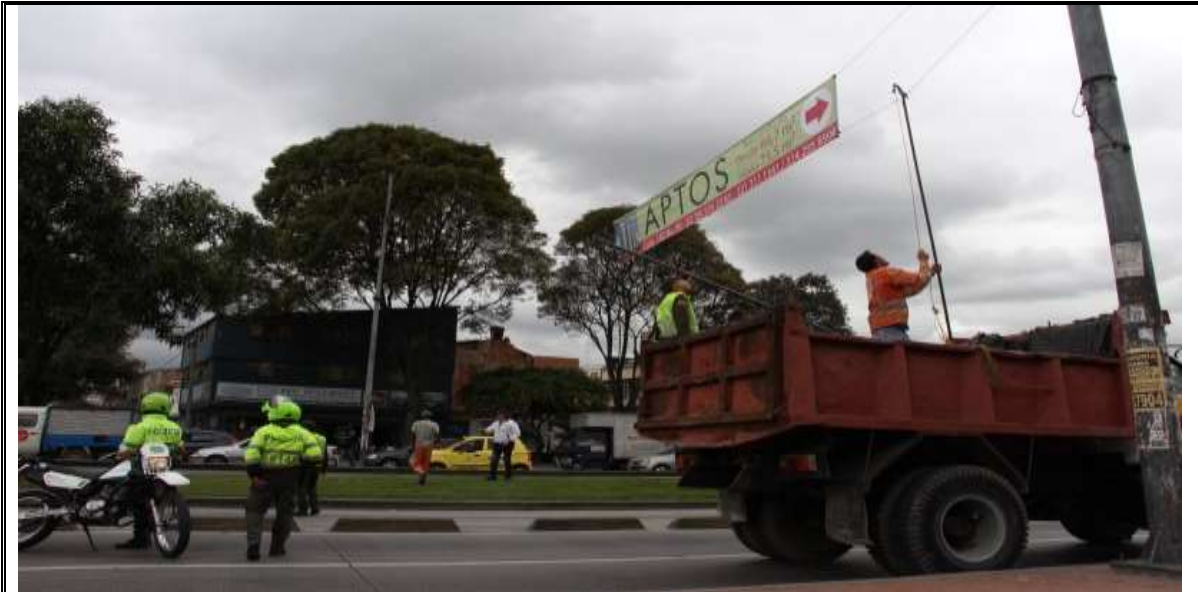
Fotografía No. 2. Elementos instalados en Espacio Público. Operativo en la Localidad de Suba, día 11 de Abril de 2015. Valla en la dirección Carrera 101 # 141-77, al frente del establecimiento EVG Cocinas Integrales.